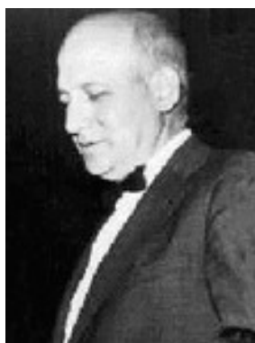
Figure 10: John Presper Eckert