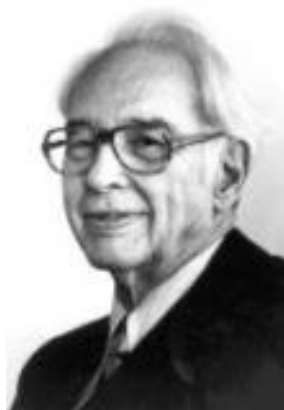
Figure 7: John Vincent Atanasoff