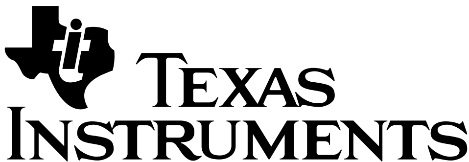
Figure 4: Le logo de Texas Instruments

C'est le premier calculateur à programme d'Europe et le premier calculateur à utiliser avec succès la virgule flottante.