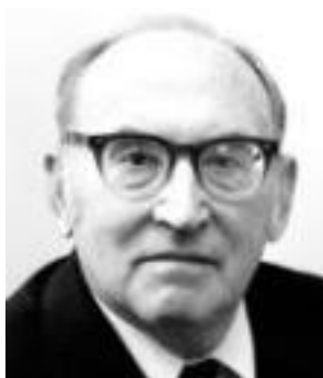
Figure 9: Sir Maurice Vincent Wilkes