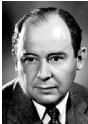
Figure 8: John Von Neumann