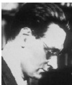
Figure 6: Konrad Zuse