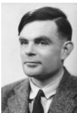
Figure 5: Alan Mathison Turing