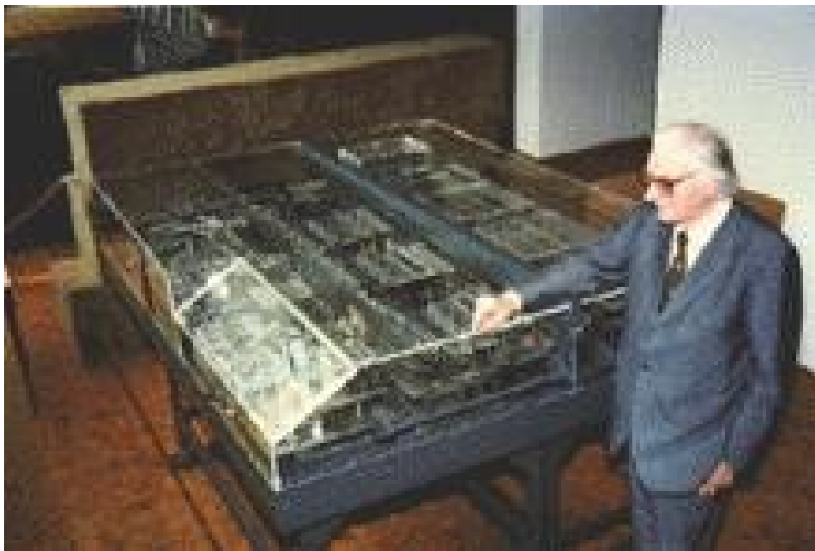
Figure 1: Konrad Zuse devant le Versuchmodell 1 ou Z1