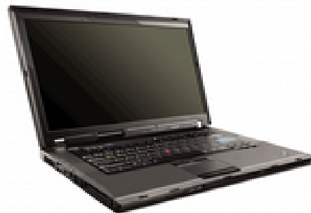
Portable classique « Laptop »